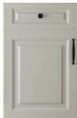
门型：GD-901 编号：CMA-564 西班牙米灰