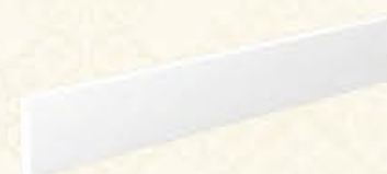
编号 MF42 尺寸 高100