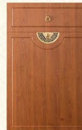
门型: GD-102 编号: CMA-543 金丝樱桃