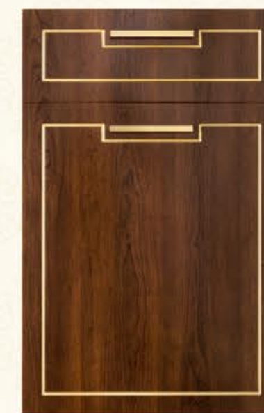
门型：GD-601 编号：CMA-571 古典胡桃（描金）