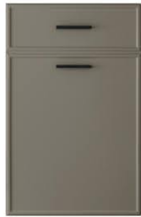
门型: GD-204 编号: CMA-565 劳伦特灰