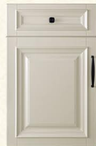
门型: GD-302 编号: CMA-564 西班牙米灰