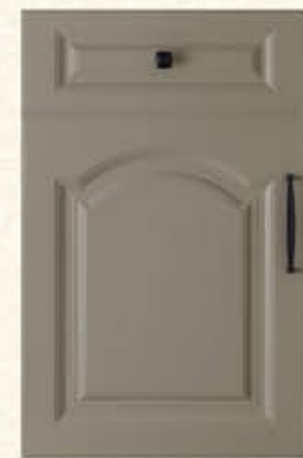
门型：GD-903 编号：CMA-565劳伦特灰