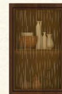
门型: 单孔玻璃门(烟雨蒙蒙茶玻) 编号: CMA-571 古典胡桃