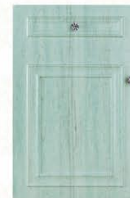
门型: GD-501 编号: CMA-567 景泰蓝