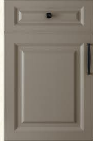
门型: GD-901 编号: CMA-565 劳伦特灰