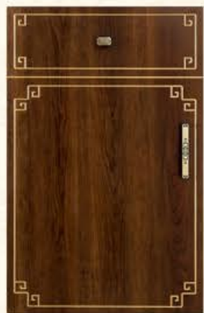
门型: GD-104 编号: CMA-571 古典胡桃(描金)