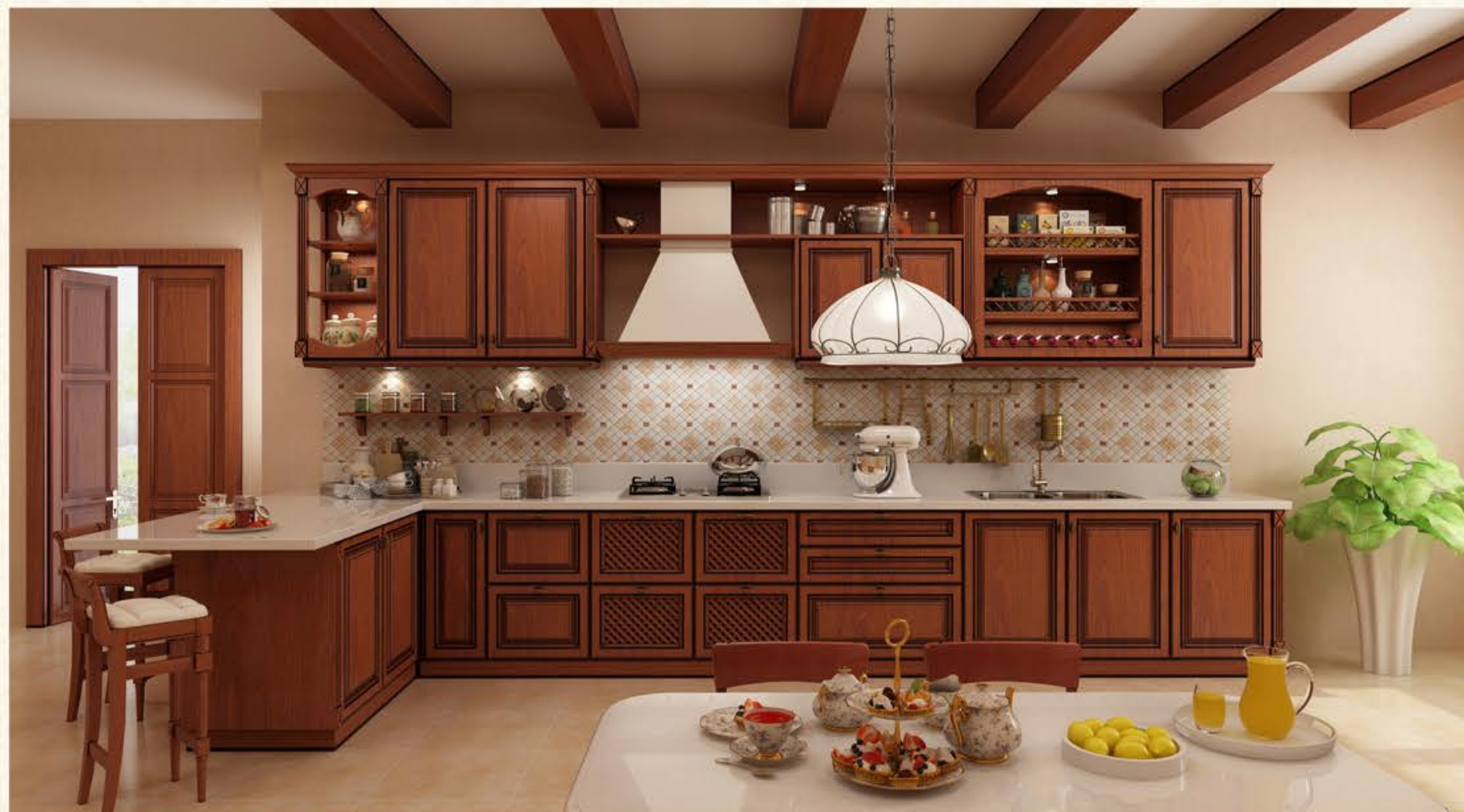
门型名称：GD-101 膜皮颜色：CMA-543（金丝樱桃仿古）