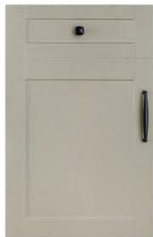
门型：GD-201 编号：CMA-560 素布纹