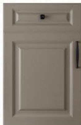
门型：GD-901 编号：CMA-565 劳伦特灰