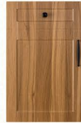
门型: GD-201 编号: CMA-561 现代胡桃