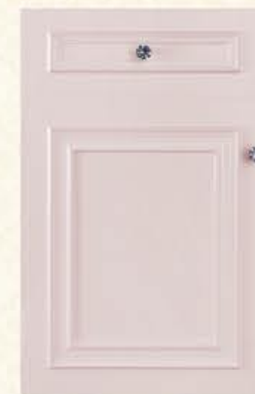
门型：GD-501 编号：CMA-557 芭比粉