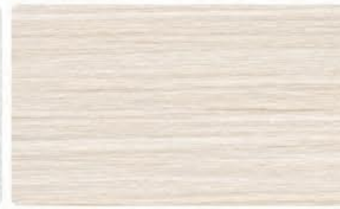
CMA-539 书香桐 (可做描金、描银效果)