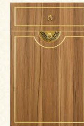
门型: GD-102 编号: CMA-561 现代胡桃(描金)