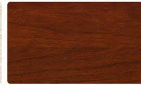
CMA-540 实木樱桃 (可做仿古/描金/描银效果)