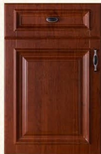
门型：GD-303 编号：CMA-540 实木樱桃