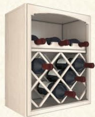
编号 MG14 尺寸 宽600*深570*高680