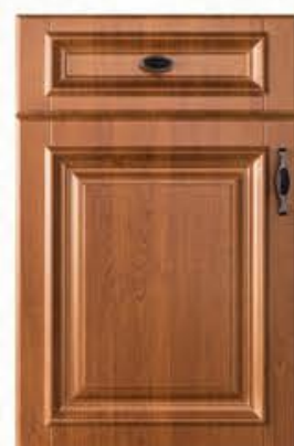
门型: GD-303 编号: CMA-543 金丝樱桃