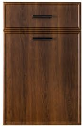
门型: GD-204 编号: CMA-571 古典胡桃