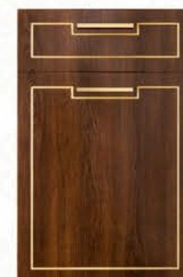
门型: GD-601 编号: CMA-571 古典胡桃(描金)