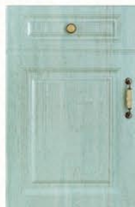
门型：GD-902 编号：CMA-567 景泰蓝