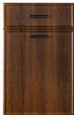
门型: GD-204 编号: CMA-571 古典胡桃