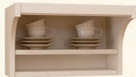
编号 MT04 尺寸 宽450*深300*高300