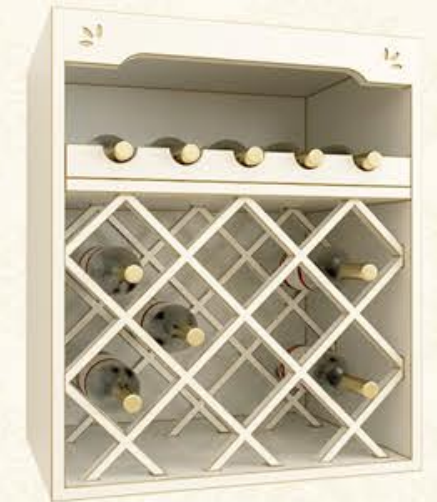
编号 MG14 尺寸 宽600*深570*高680