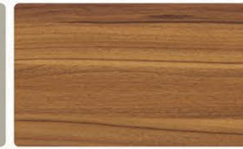
CMA-561 现代胡桃 (可做仿古/描金/描银效果)