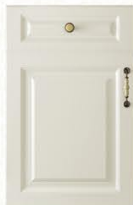
门型：GD-901 编号：CMA-545 天使白