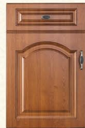
门型：GD-903 编号：CMA-543金丝樱桃(仿古)