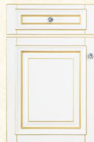
门型: GD-302 编号: CMA-544 珉琅白(描金)