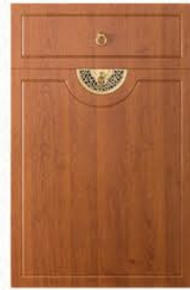
门型: GD-102 编号: CMA-543 金丝樱桃