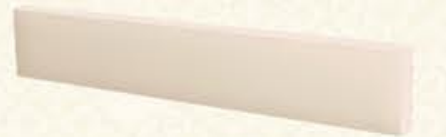
编号 MF42 尺寸 高100