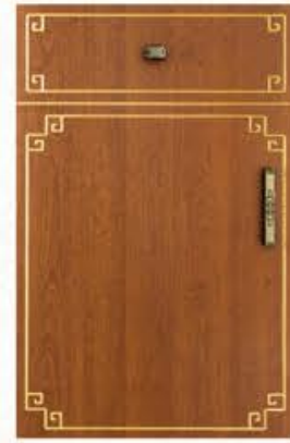
门型: GD-104 编号: CMA-543 金丝樱桃(描金)