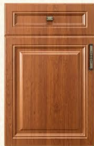
门型：GD-101 编号：CMA-543 金丝樱桃