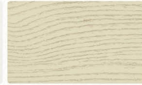
CMA-548 欧洲橡 (可做仿古效果)