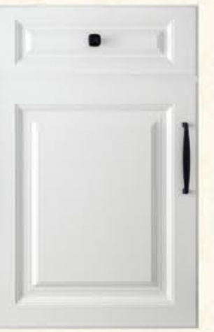
门型: GD-901 编号: CMA-563 银河白