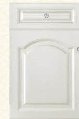
门型：GD-903 编号：CMA-506珠光白木纹

Copy is like a grand ball instantaneous fixation, excellent sonata screaming hall, sudden stop light reflection solidification in space, Florence, build a gorgeous and very visual feast for you. In the details between interprets the special taste, in between activity deduce noble consciousness. This is the best state, "can touch of luxury."