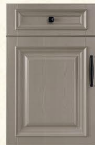
门型: GD-302 编号: CMA-565 劳伦特灰