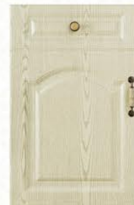
门型：GD-903 编号：CMA-548 欧洲橡