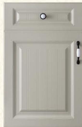
门型：GD-902 编号：CMA-564 西班牙米灰