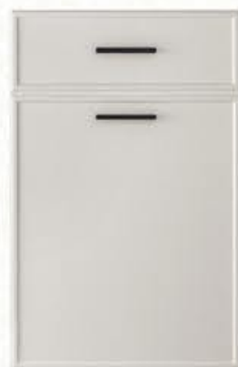
门型: GD-204 编号: CMA-559 雅布纹