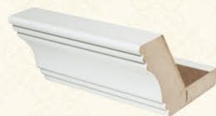
编号 BFA02 尺寸 高53