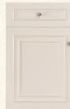
门型：GD-501 编号：CMA-568 卡布奇诺