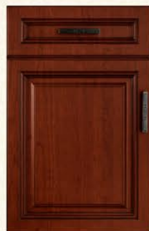
门型：GD-101 编号：CMA-540 实木樱桃(仿古)

Only need to choose a, in the romantic amorous feelings to breathe gently sing; It's hand in hand to embrace of happiness, it is sweet and intimate encounters of life, infatuated, frequent soul dancing in smooth texture, natural hues, whispered softly.