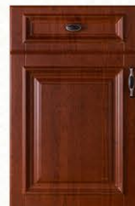
门型: GD-303 编号: CMA-540 实木樱桃