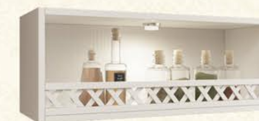
编号 MG29 尺寸 宽800*深350*高350