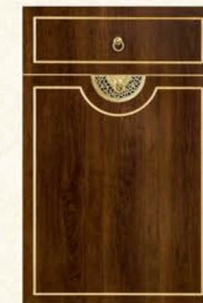
门型: GD-102 编号: CMA-571 古典胡桃(描金)