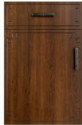
门型: GD-104 编号: CMA-571 古典胡桃(仿古)