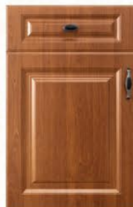
门型：GD-901 编号：CMA-543 金丝樱桃