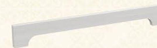
编号 MJ01 尺寸 高100