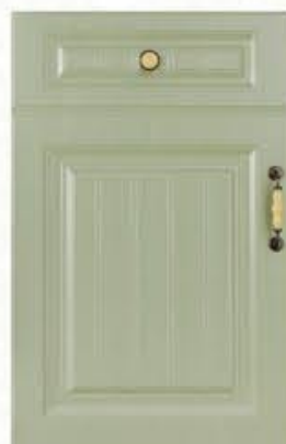
门型：GD-902 编号：CMA-566 雨林绿