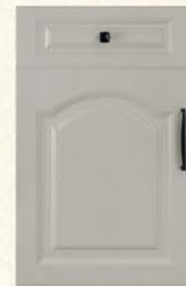
门型：GD-903 编号：CMA-564西班牙米灰