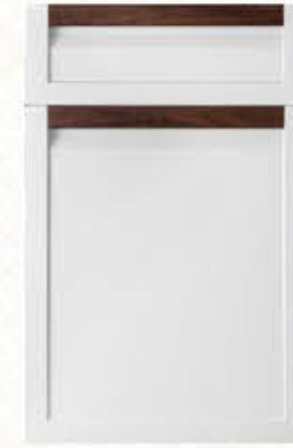
门型: GD-202 编号: CMA-563 银河白