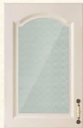
编号 单孔玻璃门 尺寸 配青花芙蓉砂玻璃(清玻)