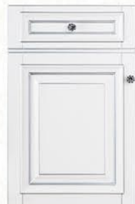
门型: GD-302 编号: CMA-544 珐琅白(描银)