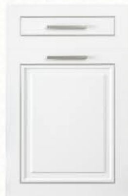
门型：GD-602 编号：CMA-544 珉琅白(描银)