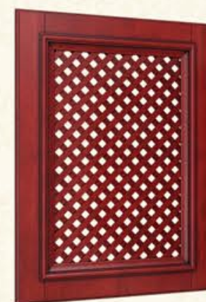
编号 网格门 尺寸