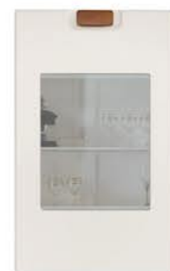
门型：GD-203 单孔玻璃门-蓝灰玻璃 编号：CMA-562 提拉米苏皮纹