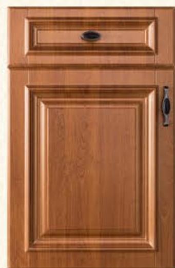
门型：GD-303 编号：CMA-543 金丝樱桃