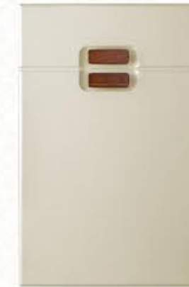
门型: GD-203 编号: CMA-562 提拉米苏皮纹