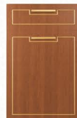
门型: GD-601 编号: CMA-543 金丝樱桃(描金)