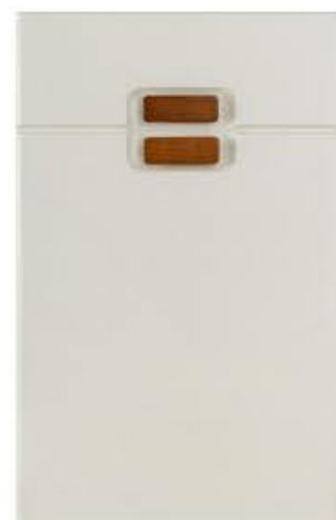
门型：GD-203 编号：CMA-559 雅布纹