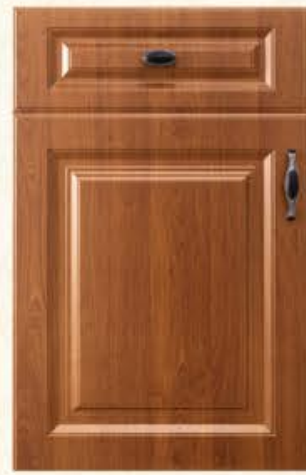
门型: GD-901 编号: CMA-543 金丝樱桃