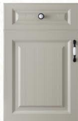
门型：GD-902 编号：CMA-564 西班牙米灰