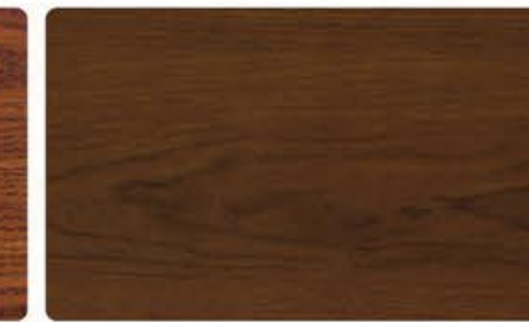
CMA-571 古典胡桃 (可做仿古/描金/描银效果)