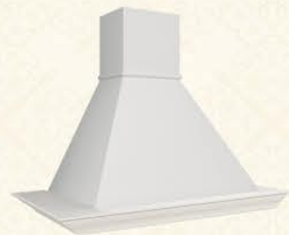
编号 MH08 尺寸 宽1050*深575*高800