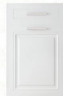
门型: GD-602 编号: CMA-503 暖白麻面