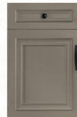
门型: GD-501 编号: CMA-565 劳伦特灰