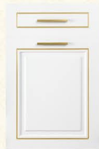
门型：GD-602 编号：CMA-544 珧琅白(描金)