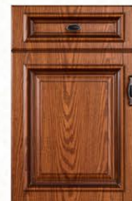
门型: GD-303 编号: CMA-570 美国橡木(仿古)