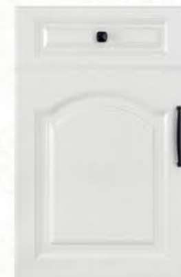
门型：GD-903 编号：CMA-563 银河白