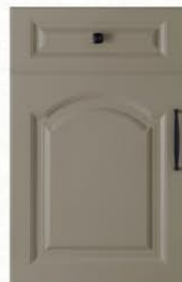
门型：GD-903 编号：CMA-565 劳伦特灰