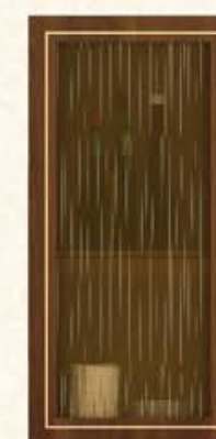
门型：单孔玻璃门（烟雨蒙蒙茶玻） 编号：CMA-543 金丝樱桃