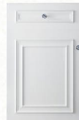
门型: GD-501 编号: CMA-563 银河白