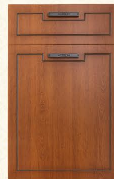
门型：GD-601 编号：CMA-543 金丝樱桃（仿古）