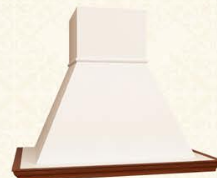
编号 MH08 尺寸 宽1050*深575*高800