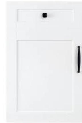
门型：GD-201 编号：CMA-503 暖白麻面