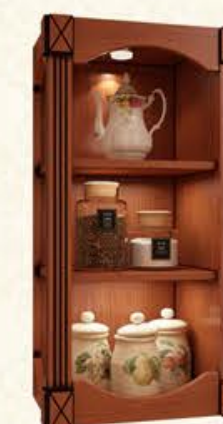
编号 MG12 尺寸 宽450*深350*高800 罗马柱型根据当套罗马柱 工艺配套