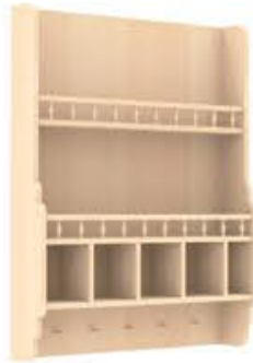
编号: SG-100 颜色: 榉木水性木蜡油 尺寸: 高1200*宽900/1000*深200mm