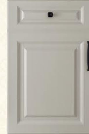
门型: GD-901 编号: CMA-564 西班牙米灰