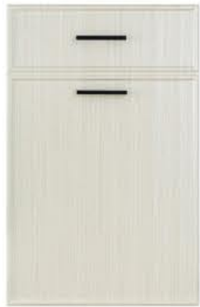
门型: GD-204 编号: CMA-539 书香桐