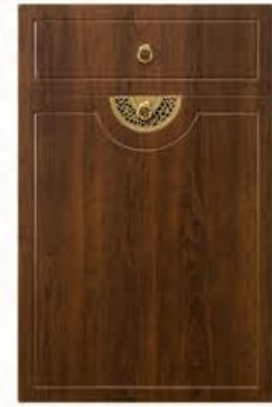
门型: GD-102 编号: CMA-571 古典胡桃