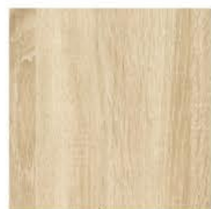
名称：开放柜 膜皮编号：CS-840 挪威森林