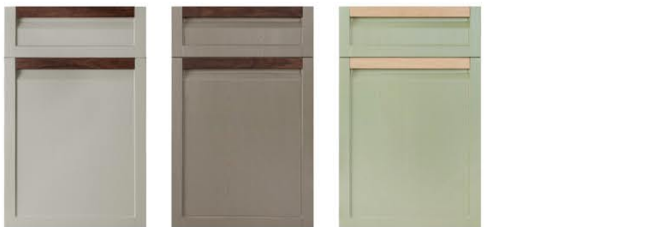
门型：GD-202 编号：CMA-564 西班牙米灰