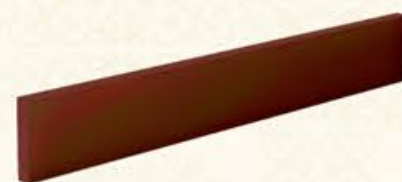
编号 MF42 尺寸 高100