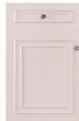
门型: GD-501 编号: CMA-557 芭比粉