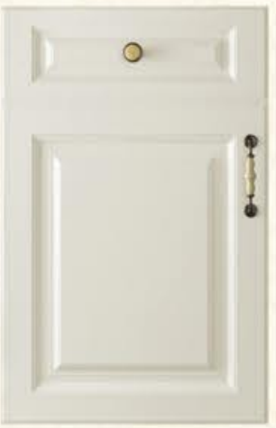
门型: GD-901 编号: CMA-545 天使白