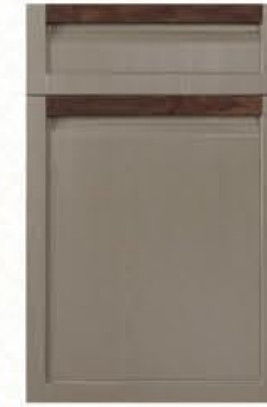
门型: GD-202 编号: CMA-565 劳伦特灰