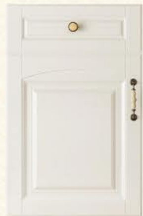
门型：GD-904 编号：CMA-545 天使白