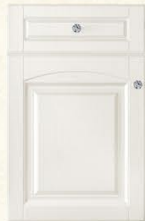
门型：GD-904 编号：CMA-506 珠光白木纹