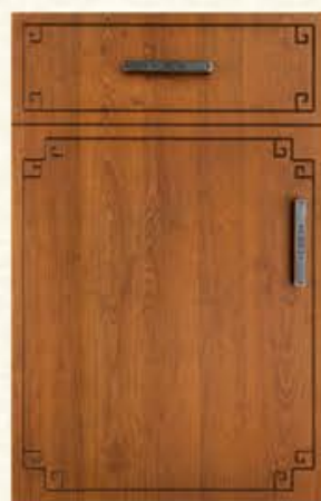
门型: GD-104 编号: CMA-543 金丝樱桃(仿古)