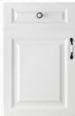
门型：GD-901 编号：CMA-503 暖白麻面