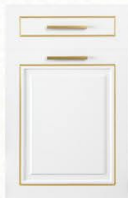
门型：GD-602 编号：CMA-544 珉琅白(描金)