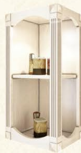
编号 MG12 尺寸 宽450/350/400*深350*高800 罗马柱型根据当页罗马柱 工艺配套