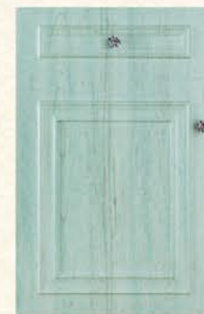
门型：GD-501 编号：CMA-567 景泰蓝