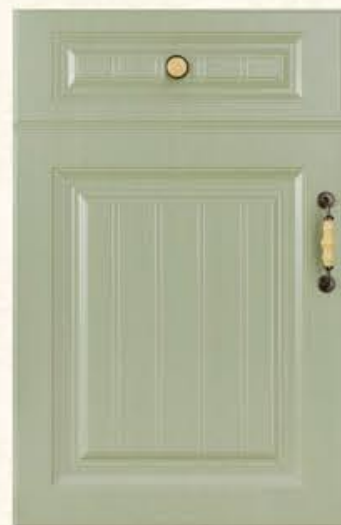
门型：GD-902 编号：CMA-566 雨林绿