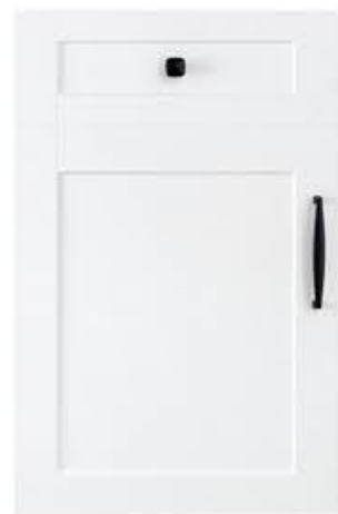
门型：GD-201 编号：CMA-503 暖白麻面