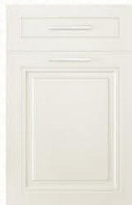
门型：GD-602 编号：CMA-506 珠光白木纹