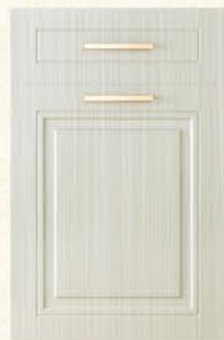
门型：GD-602 编号：CMA-539 书香桐