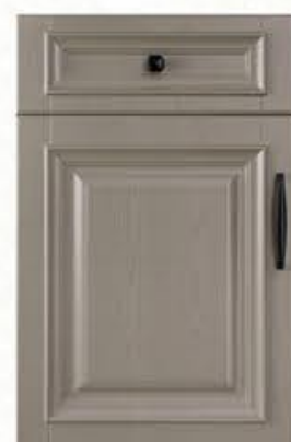
门型: GD-302 编号: CMA-565 劳伦特灰