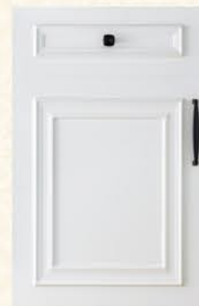
门型：GD-501 编号：CMA-503 暖白麻面

Like no longer constrained by the style of a pattern. Free along with the gender of life should be attributed to the bosom of nature. The slide of time, like the wild in the sunshine, warmth.