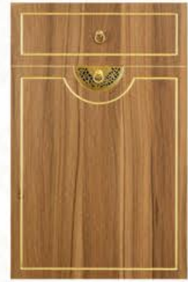
门型: GD-102 编号: CMA-561 现代胡桃(描金)