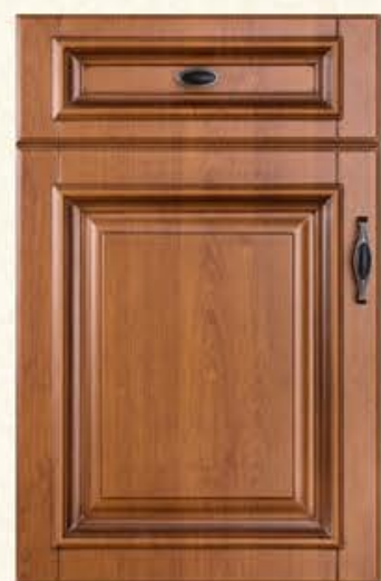
门型：GD-303 编号：CMA-543 金丝樱桃(仿古)