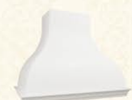
编号: MH-10 尺寸: 宽1050*深580*高800