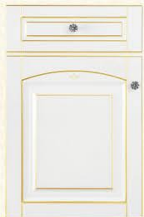
门型：GD-904 编号：CMA-544 玳瑁白(描金)