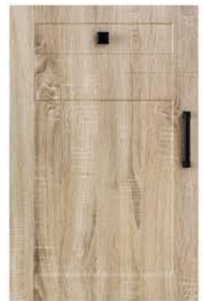
门型：GD-201 编号：CMA-569 幻影木纹