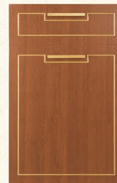
门型：GD-601 编号：CMA-543 金丝樱桃（描金）