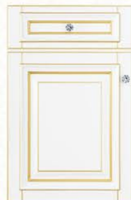
门型: GD-302 编号: CMA-544 珐琅白(描金)