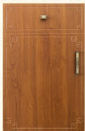
门型: GD-104 编号: CMA-543 金丝樱桃