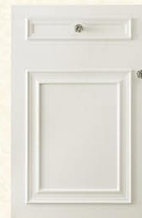
门型：GD-501 编号：CMA-545 天使白