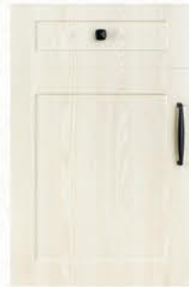
门型: GD-201 编号: CMA-554 湖光橡木