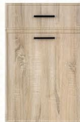
门型: GD-204 编号: CMA-569 幻影木纹