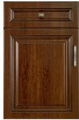
门型: GD-101 编号: CMA-571 古典胡桃