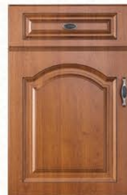
门型：GD-903 编号：CMA-543 金丝樱桃(仿古)