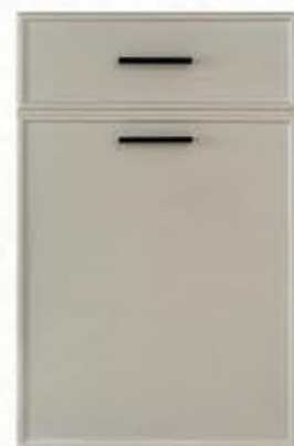
门型: GD-204 编号: CMA-560 素布纹