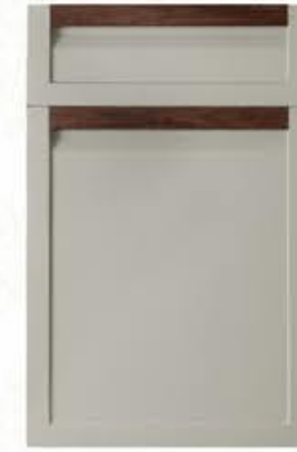
门型: GD-202 编号: CMA-564 西班牙米灰