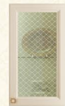
单孔玻璃门 配青花笑蒙砂玻璃(清玻)