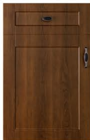
门型：GD-201 编号：CMA-571 古典胡桃