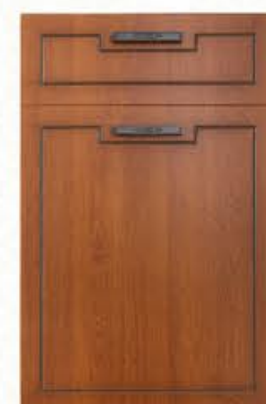
门型: GD-601 编号: CMA-543 金丝樱桃(仿古)