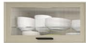
编号: 单孔玻璃门 配布纹蒙砂玻璃(清玻)

CHINA'S MOST PROFESSIONAL PRODUCTION PLATFORM CABINETS