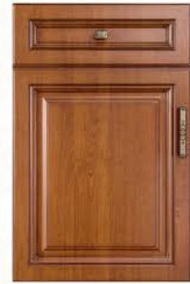
门型: GD-101 编号: CMA-543 金丝樱桃(仿古)