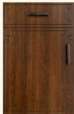
门型: GD-104 编号: CMA-571 古典胡桃(仿古)