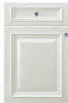
门型: GD-302 编号: CMA-506 珠光白木纹