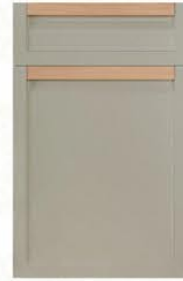
门型: GD-202 编号: CMA-560 素布纹