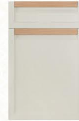
门型: GD-202 编号: CMA-CMA-559 雅布纹