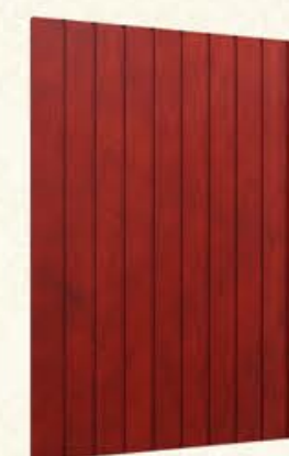
编号 装饰板 尺寸 间距70, 槽深2, 厚18