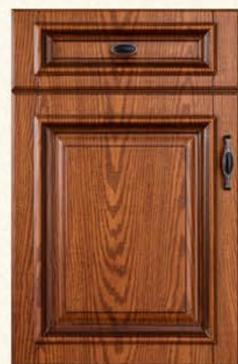
门型：GD-303 编号：CMA-570 美国橡木(仿古)

Copy is like a grand ball instantaneous fixation, excellent sonata screeching halt, sudden stop light reflection solidification in space. Florence, build a gorgeous and very visual feast for you. In the details between interprets the special taste, in between activity deduce noble consciousness. This is the best state. - can touch of luxury.