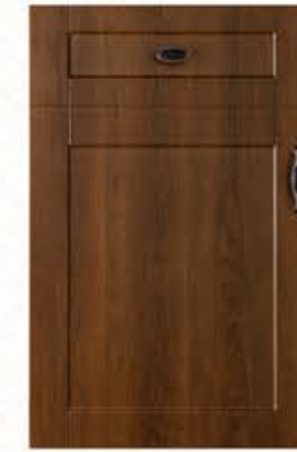
门型: GD-201 编号: CMA-571 古典胡桃