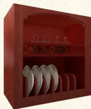
编号 MG07 尺寸 宽900*深350*高800