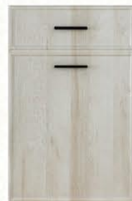
门型: GD-204 编号: CMA-558 北美橡