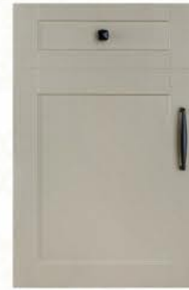
门型: GD-201 编号: CMA-560 素布纹