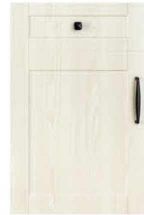
门型：GD-201 编号：CMA-554 湖光橡木