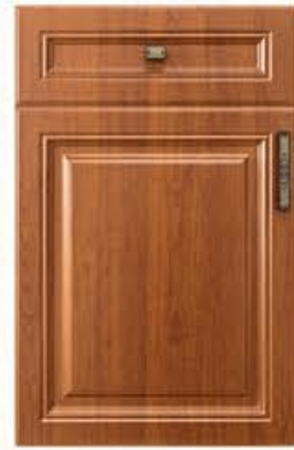
门型: GD-101 编号: CMA-543 金丝樱桃