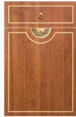
门型: GD-102 编号: CMA-543 金丝樱桃(描金)