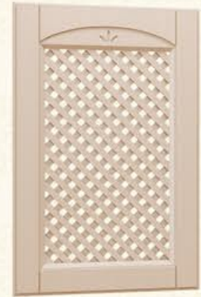
编号 网格门 尺寸