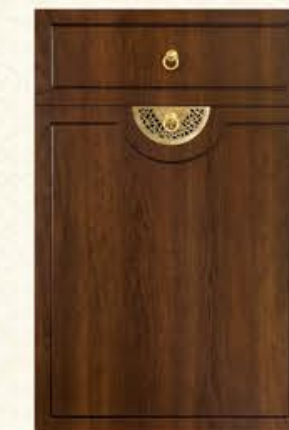
门型: GD-102 编号: CMA-571 古典胡桃(仿古)