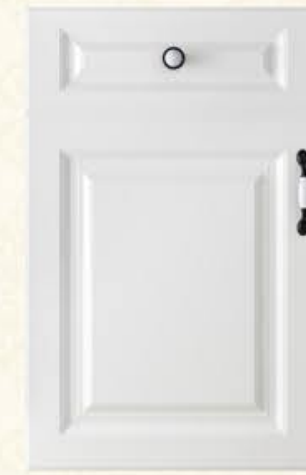
门型: GD-901 编号: CMA-503 暖白麻面