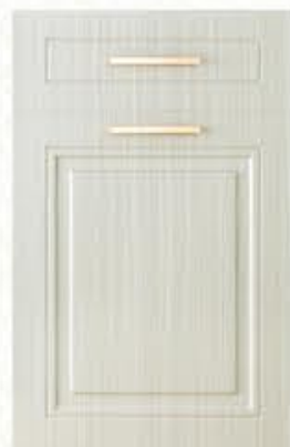
门型：GD-602 编号：CMA-539 书香桐