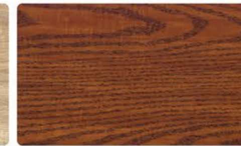
CMA-570 美国橡木 (可做仿古效果)