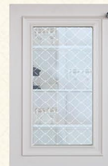
编号 单孔玻璃门 尺寸 配青花芙蓉砂玻璃(清玻)