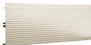
名称：银色铝踢脚板 高度：100MM