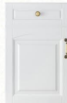
门型：GD-904 编号：CMA-503 暖白麻面