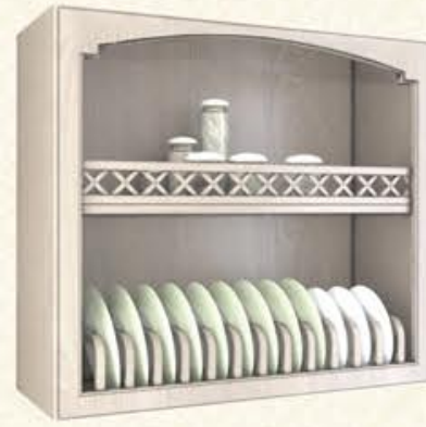
编号 MG07 尺寸 宽900*深350*高800