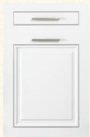
门型：GD-602 编号：CMA-544 珧琅白(描银)