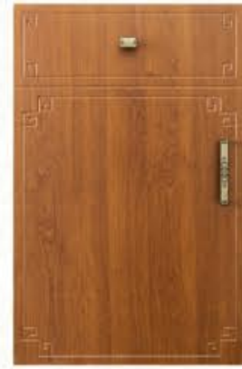
门型: GD-104 编号: CMA-543 金丝樱桃