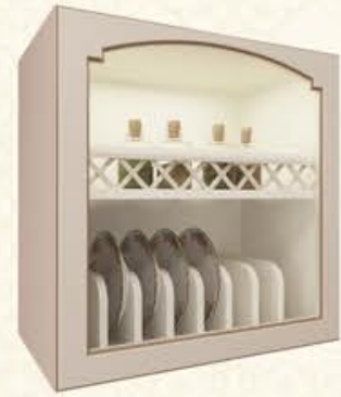
编号 MG07 尺寸 宽900*深350*高800