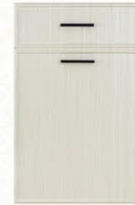
门型: GD-204 编号: CMA-539 书香桐