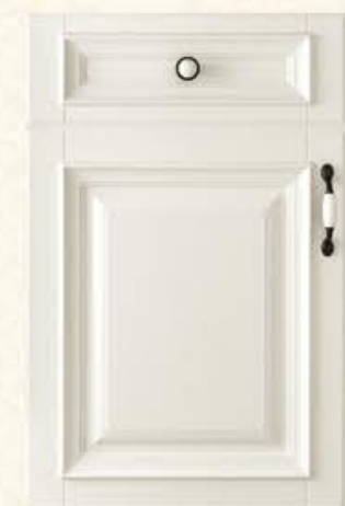
门型: GD-302 编号: CMA-545 天使白