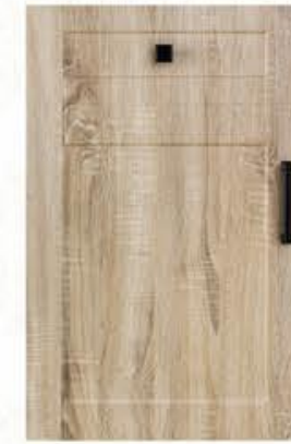
门型: GD-201 编号: CMA-569 幻影木纹