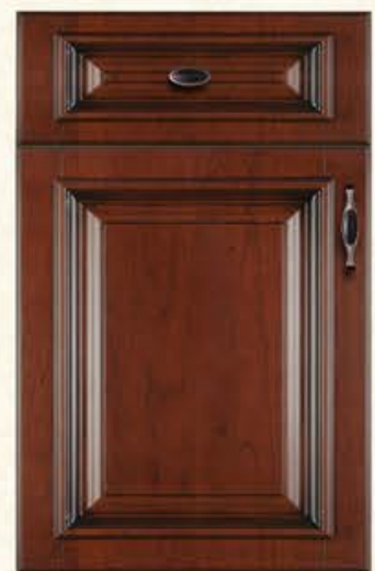
门型：GD-303 编号：CMA-540 实木樱桃(仿古)