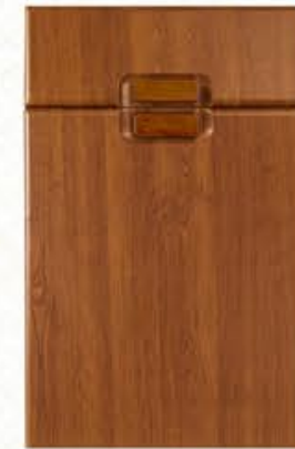
门型: GD-203 编号: CMA-543 金丝樱桃