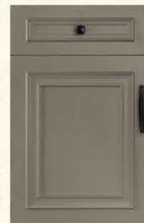
门型：GD-501 编号：CMA-565 劳伦特灰