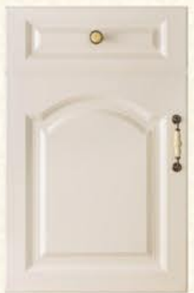
门型：GD-903 编号：CMA-568卡布奇诺