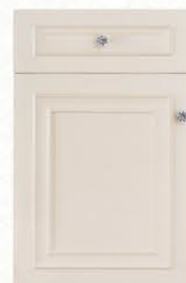
门型: GD-501 编号: CMA-568 卡布奇诺