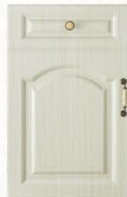
门型：GD-903 编号：CMA-539 书香桐