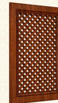
编号 网格门 尺寸