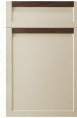
门型: GD-202 编号: CMA-562 提拉米苏皮纹