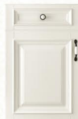
门型: GD-302 编号: CMA-545 天使白