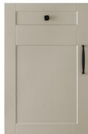
门型：GD-201 编号：CMA-564 西班牙米灰