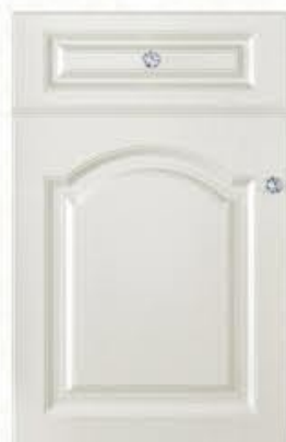
门型：GD-903 编号：CMA-506 珠光白木纹