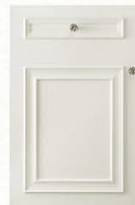
门型: GD-501 编号: CMA-545 天使白