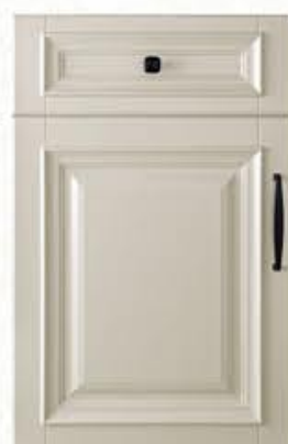
门型: GD-302 编号: CMA-564 西班牙米灰