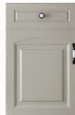
门型：GD-904 编号：CMA-564 西班牙米灰