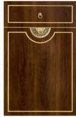
门型: GD-102 编号: CMA-571 古典胡桃(描金)