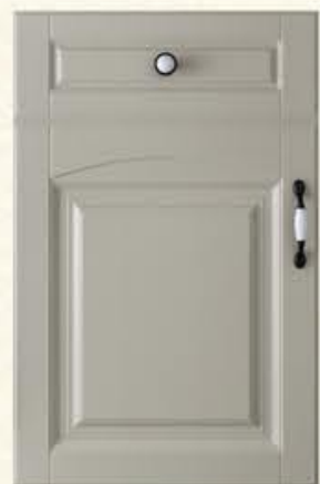
门型：GD-904 编号：CMA-564 西班牙米灰