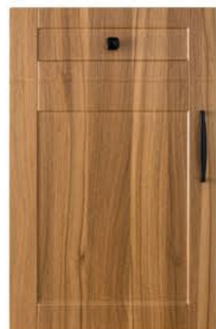
门型：GD-201 编号：CMA-561 现代胡桃