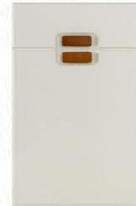
门型: GD-203 编号: CMA-559 雅布纹