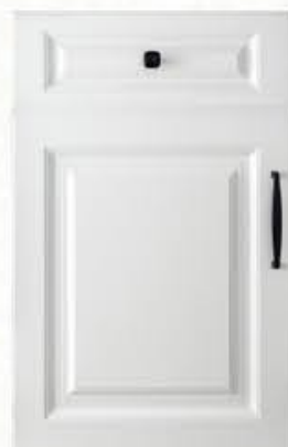
门型：GD-901 编号：CMA-563 银河白