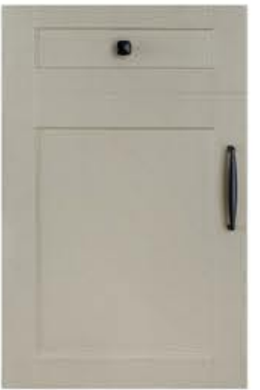
门型：GD-201 编号：CMA-560 素布纹