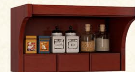
编号 MT01 尺寸 宽450*深300*高300