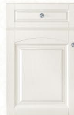
门型：GD-904 编号：CMA-506 珠光白木纹