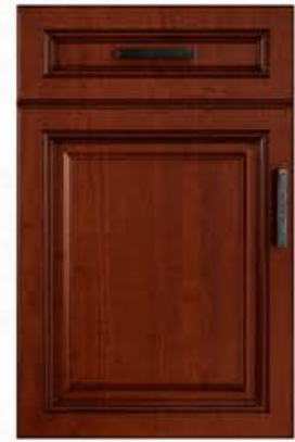
门型: GD-101 编号: CMA-540 实木樱桃(仿古)