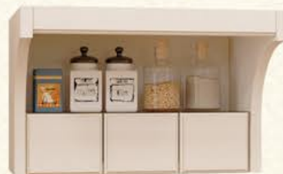
编号 MT01 尺寸 宽(不限)450*深300*高300