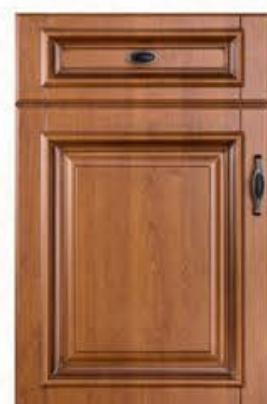
门型: GD-303 编号: CMA-543 金丝樱桃(仿古)