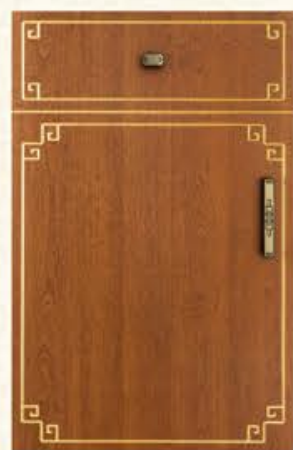
门型: GD-104 编号: CMA-543 金丝樱桃(描金)