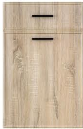
门型: GD-204 编号: CMA-569 幻影木纹