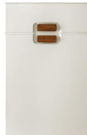
门型：GD-203 编号：CMA-506 珠光白木纹