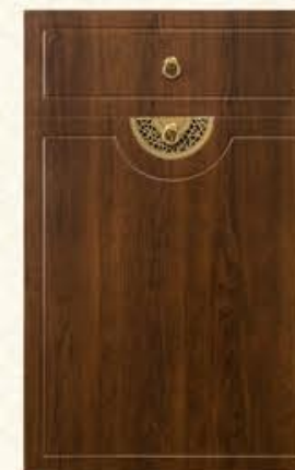
门型: GD-102 编号: CMA-571 古典胡桃