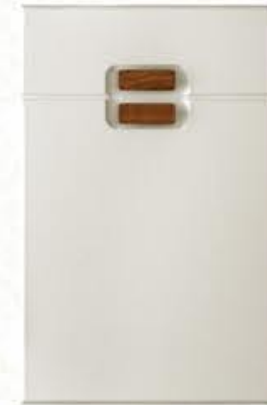
门型: GD-203 编号: CMA-506 珠光白木纹