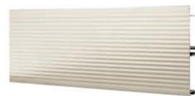
名称：银色铝踢脚板 高度：100MM