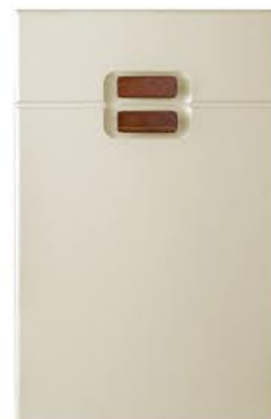
门型：GD-203 编号：CMA-562 提拉米苏皮纹