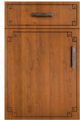
门型: GD-104 编号: CMA-543 金丝樱桃(仿古)