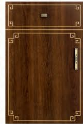
门型: GD-104 编号: CMA-571 古典胡桃(描金)