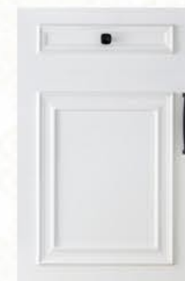
门型: GD-501 编号: CMA-503 暖白麻面