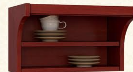
编号 MT04 尺寸 宽900*深300*高300