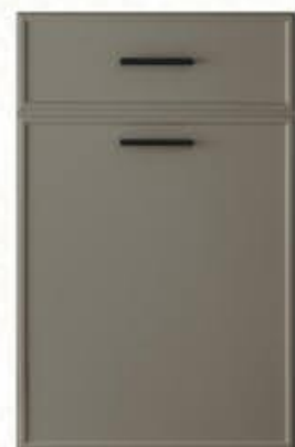
门型: GD-204 编号: CMA-565 劳伦特灰