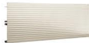
名称: 银色铝脚踏板 高度: 100MM