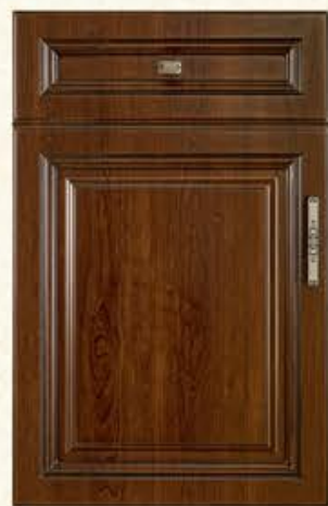
门型：GD-101 编号：CMA-571 古典胡桃