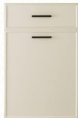
门型: GD-204 编号: CMA-562 提拉米苏皮纹