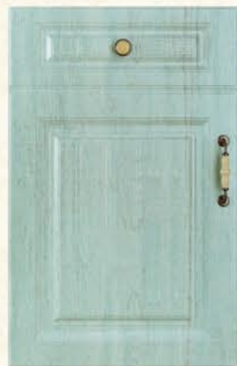
门型：GD-902 编号：CMA-567 景泰蓝