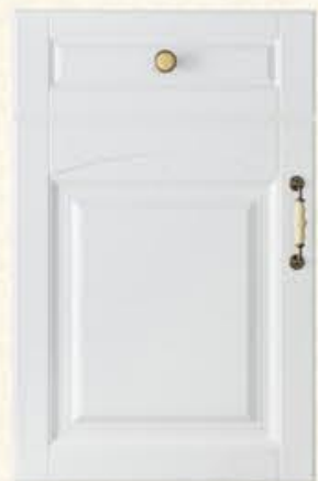
门型：GD-904 编号：CMA-503 暖白麻面

This is not the pinnacle of art, this is only part of the beauty of art. This is not the dizzying array of life beautiful garden, this is a way station of happiness. How many story waiting for us to continue, however, how many waiting for us to find beauty.