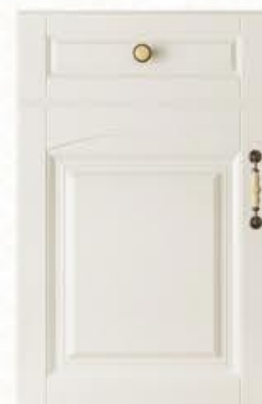
门型：GD-904 编号：CMA-545 天使白