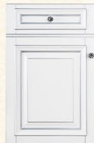
门型: GD-302 编号: CMA-544 珉琅白(描银)