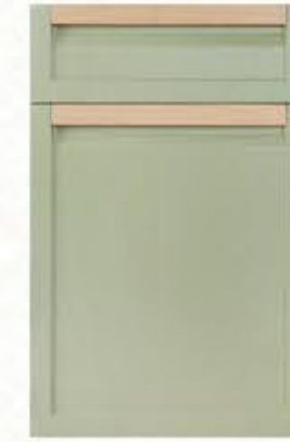
门型: GD-202 编号: CMA-566 雨林绿