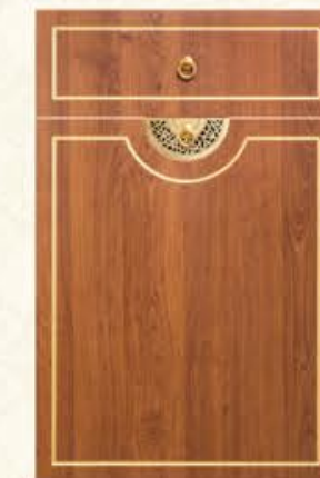
门型: GD-102 编号: CMA-543 金丝樱桃(描金)