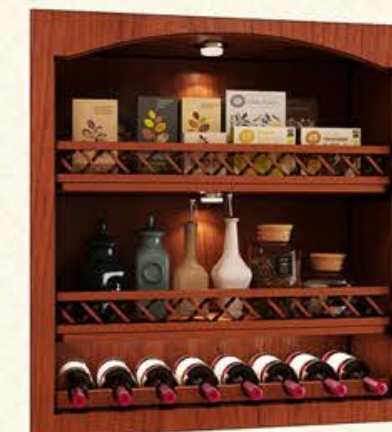
编号 MG23 尺寸 宽900*深350*高800