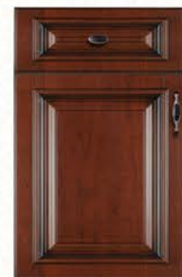
门型: GD-303 编号: CMA-540 实木樱桃(仿古)