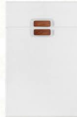
门型: GD-203 编号: CMA-503 暖白麻面