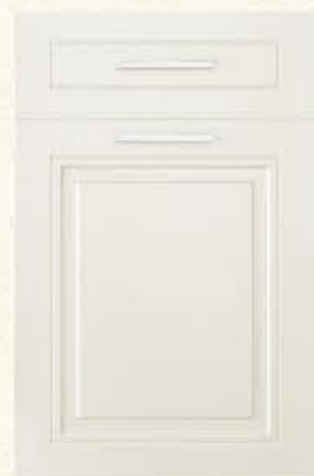
门型：GD-602 编号：CMA-506 珠光白木纹