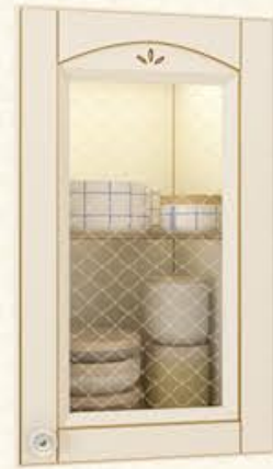
编号 单孔玻璃门 尺寸 配青花芙蓉砂玻璃(清波)