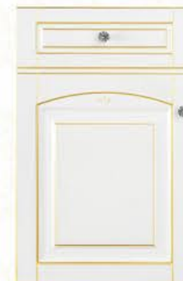
门型：GD-904 编号：CMA-544 珉琅白(描金)