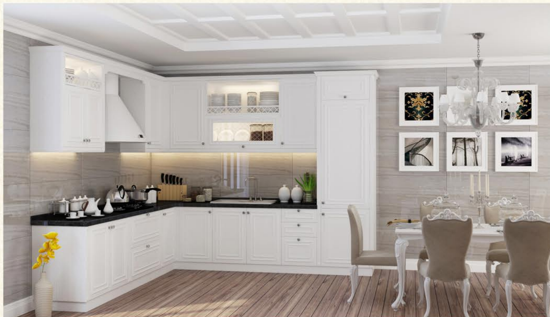
门型名称 : GD-501 膜皮颜色 : CMA-545 (天使白)