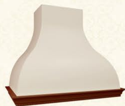
编号 MH10 尺寸 宽1050*深580*高800