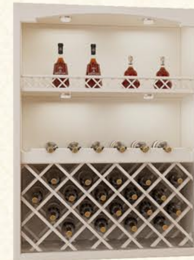
编号 MG11 尺寸 宽900*深350*高1500