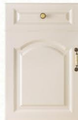
门型：GD-903 编号：CMA-568 卡布奇诺