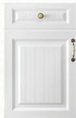
门型：GD-902 编号：CMA-503 暖白麻面