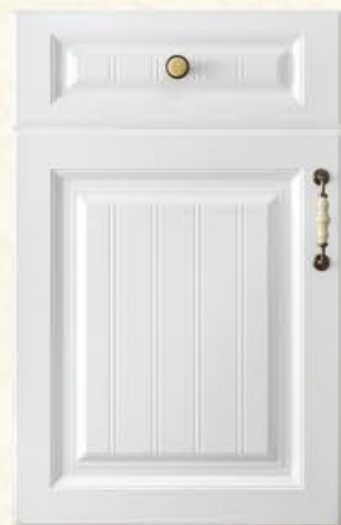
门型：GD-902 编号：CMA-503 暖白麻面