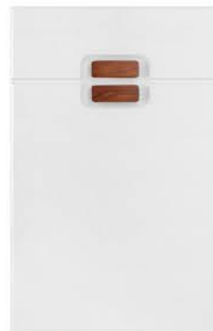
门型：GD-203 编号：CMA-503 暖白麻面