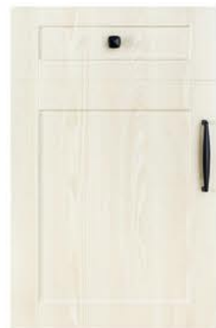
门型：GD-201 编号：CMA-554 湖光橡木