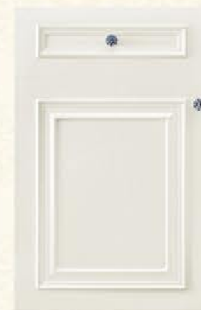
门型：GD-501 编号：CMA-506 珠光白木纹