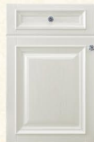
门型: GD-302 编号: CMA-506 珠光白木纹