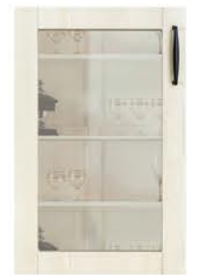
门型：GD-201单孔玻璃门(蓝灰玻璃) 编号：CMA-554湖光橡木