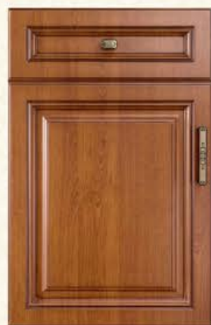
门型：GD-101 编号：CMA-543 金丝樱桃(仿古)