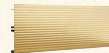
编号：金色铝踢脚板 高度：100MM