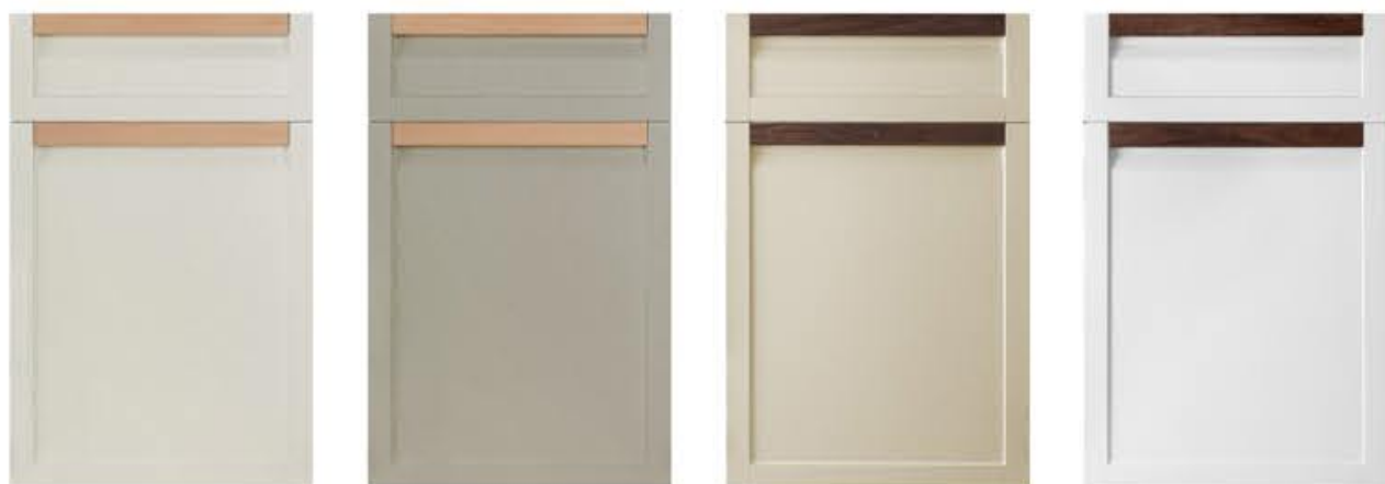
门型：GD-202 编号：CMA-CMA-559 雅布纹