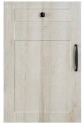
门型：GD-201 编号：CMA-558 北美橡