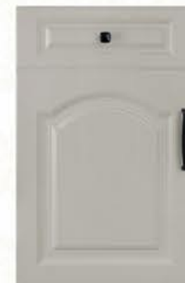
门型：GD-903 编号：CMA-564 西班牙米灰