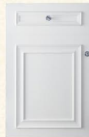
门型：GD-501 编号：CMA-563 银河白