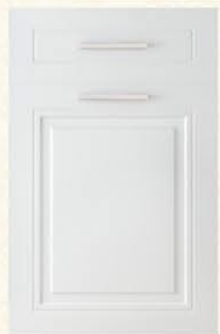
门型：GD-602 编号：CMA-503 暖白麻面