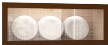
编号：原木拼框玻璃门（胡桃木） 配布纹蒙砂玻璃（清玻）