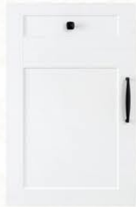
门型: GD-201 编号: CMA-503 暖白麻面