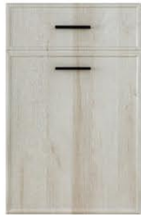
门型: GD-204 编号: CMA-558 北美橡