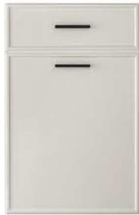
门型: GD-204 编号: CMA-559 雅布纹