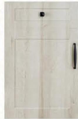
门型: GD-201 编号: CMA-558 北美橡