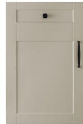
门型：GD-201 编号：CMA-564 西班牙米灰