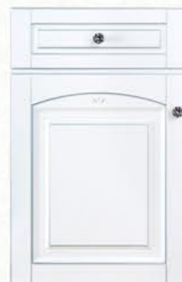
门型：GD-904 编号：CMA-544 珉琅白(描银)