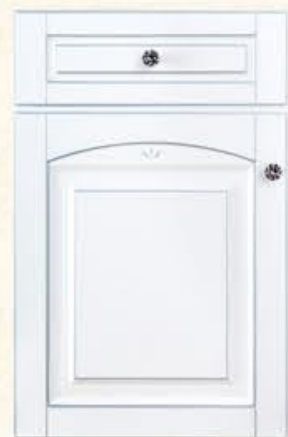
门型：GD-904 编号：CMA-544 玳瑁白(描银)