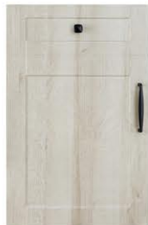
门型：GD-201 编号：CMA-558 北美橡