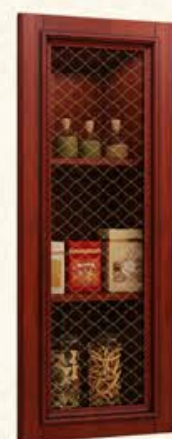
编号 单孔玻璃门 尺寸 配青花笑茶玻