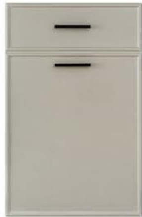
门型: GD-204 编号: CMA-560 素布纹