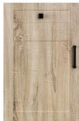
门型：GD-201 编号：CMA-569 幻影木纹