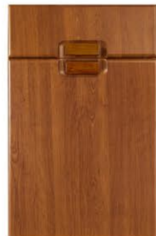
门型：GD-203 编号：CMA-543 金丝樱桃