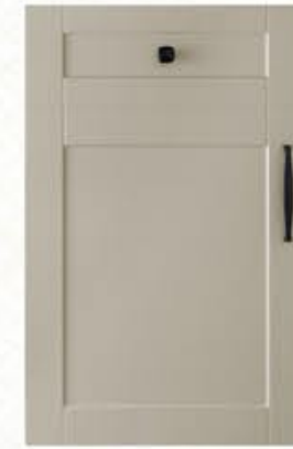
门型: GD-201 编号: CMA-564 西班牙米灰