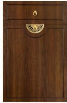
门型: GD-102 编号: CMA-571 古典胡桃(仿古)