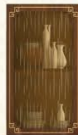
门型: 单孔玻璃门(烟雨蒙蒙茶玻) 编号: CMA-543 金丝樱桃