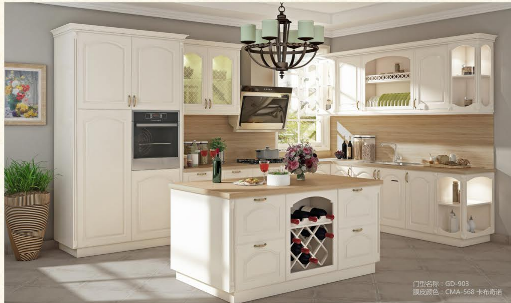
门型名称：GD-903 膜皮颜色：CMA-568 卡布奇诺