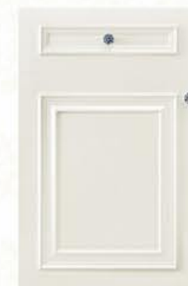
门型: GD-501 编号: CMA-506 珠光白木纹