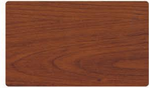
CMA-543 金丝樱桃 (可做仿古/描金/描银效果)