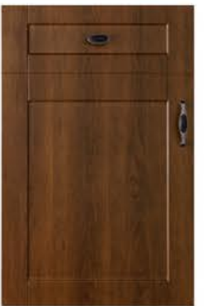
门型：GD-201 编号：CMA-571 古典胡桃