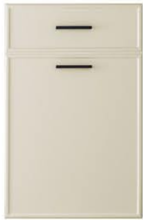
门型: GD-204 编号: CMA-562 提拉米苏皮纹